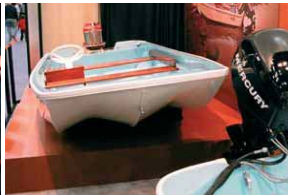
Экспозиция фирмы «Boston Whaler» позволила оценить развитие техники за 50 лет – были выставлены старые и новые модели «13-футовиков»