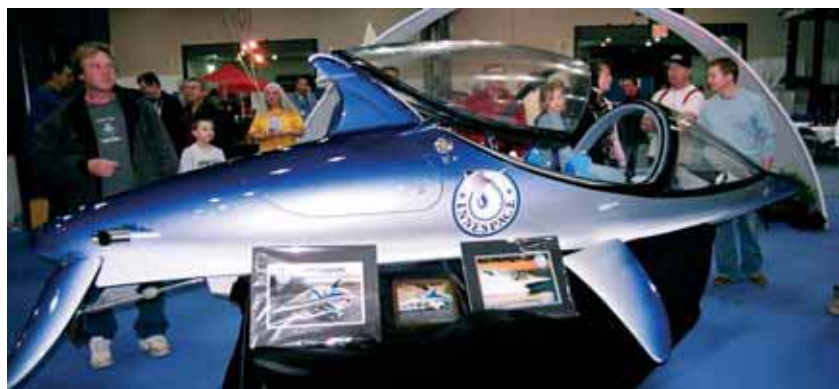
Летучая рыбка – ныряющий и выпрыгивающий из воды одноместный аппарат с 250-сильным роторным двигателем