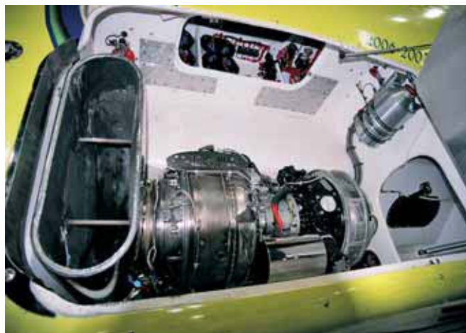
Рекордный катер «Miss Geico 113» – катамаран с двумя 1850-сильными двигателями, развивающий скорость около 360 км/ч

Победителем 2006–2007 гг. стала лодка «Miss Geico 113» (у команды есть еще три катера под тем же именем), которая и явилась той изюминкой, которая заставляет учащенно пульсировать сердца людей, любящих технику. Корпус весом 4770 кг и длиной 13.5 м, естественно катамаранных обводов, построен компанией «МТИ» из углеволокна, кевлара и специального стекловолокна. Его несут два 1850-сильных двигателя морской модификации (от вертолета «Араче»). К сожалению моему, винты с катера были сняты, но представление о пере руля и кормовой части можно было получить.