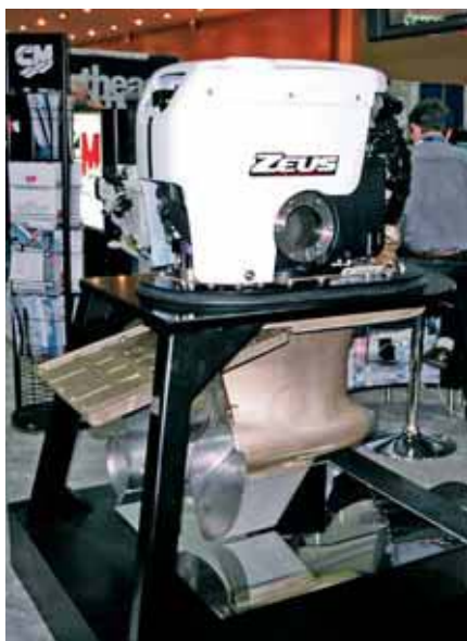
На выставке можно было видеть установку с толкающим винтом «Zeus», управляемую джойстиком (фирма «Mercury»)

Если посмотреть на корпус новой «Yamaha» глазами гидродинамика, то идеальным его назвать трудно, у других производителей можно найти более совершенные решения. Что