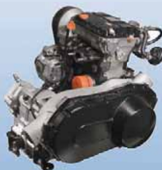
Дизельный мотор «Lambordini»