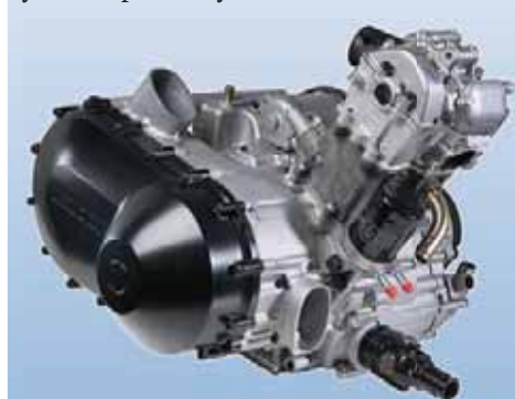
Мотор «HI» – оригинальная разработка «Arctic Cat»

Материалы предоставлены компанией «Сумеко», официального дистрибьютора «Arctic Cat».