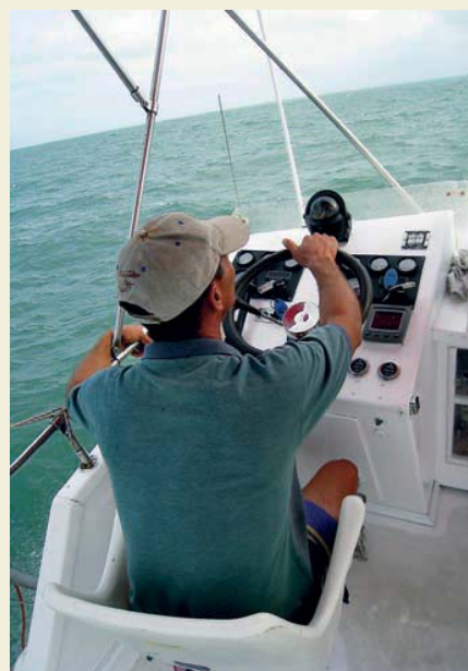
Капитан и его рабочее место

Моя же давняя мечта выйти в океан, где когда-то ловил марлина папа Хэм, наконец-то исполнилась, птичка в «голубиной книге» поставлена. Мнение сложилось. Тем, кто еще не побывал на Кубе, но мечтает об этом, рекомендую не затягивать процесс, поскольку на острове, похожем на креветку и расположенном между Карибским морем, Мексиканским заливом и Северной Америкой, сегодня все меняется очень быстро.