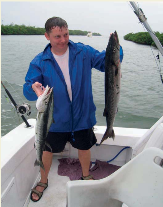
Скромные трофеи: две барракуды и скумбрия («кингфиш»)