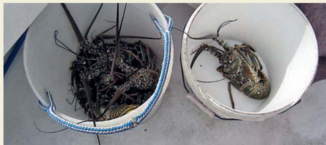
«Лангусты-лобстеры-омары», а на самом деле – лангусты, печально ждут своей участи