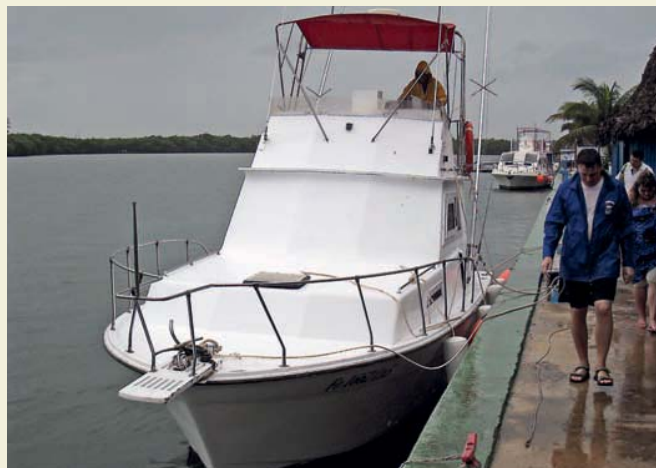
Катер, подвергшийся местной перестройке. Немного неказисто, но прочно и надежно.

лись в коллектив из шести человек, разумеется, чтобы не платить «по полной программе», и стали ждать установленного срока. Мы – это я и жена, которая сыграла огромную роль в выборе места проведения 10-дневного отпуска. Сразу надо признаться, что двое из команды являлись родней, поэтому на душе было более или менее спокойно. А зря, как потом выяснилось.