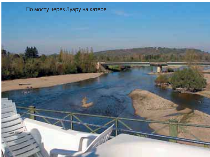
По мосту через Луару на катере