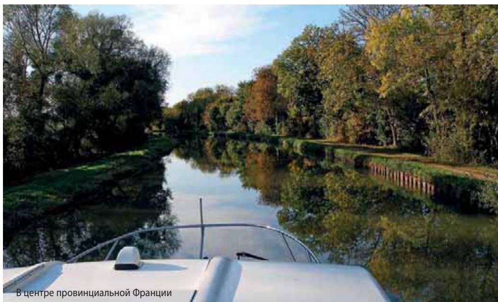
В центре провинциальной Франции

было желание познакомиться с французской глубинкой, совершить путешествие по воде, а главное – в стороне от троп, проторенных многочисленными туристами, нацеленных на знакомство со знаковыми, но широко известными памятниками культуры.