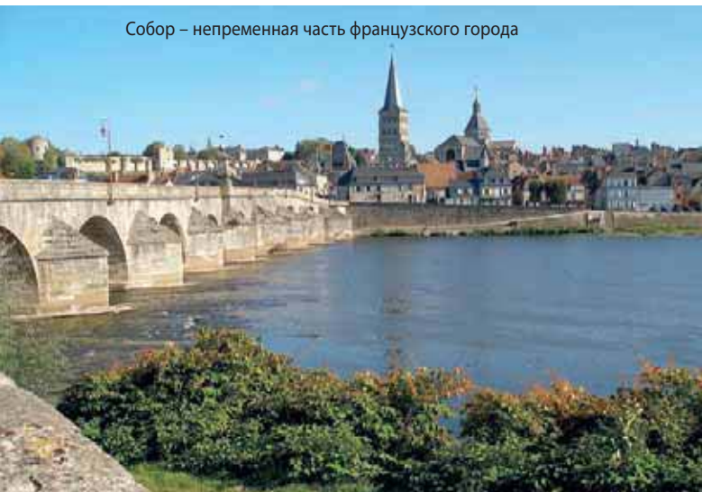
Собор – неременная часть французского города