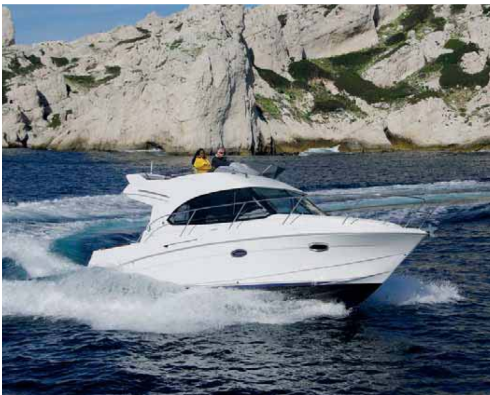
Моторная яхта «Beneteau Antares 30» на тестах «Кия» (стр. 22).