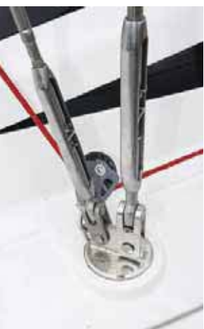
Вант-путенс: на него заведен блок «германской» проводки гика-шкота