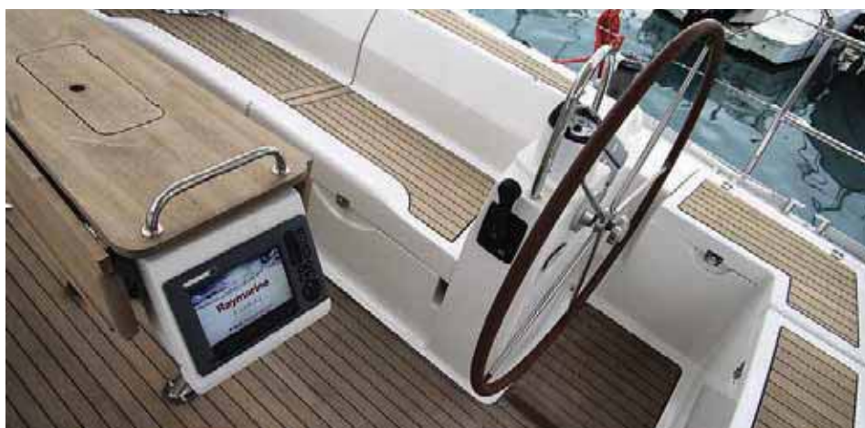
Кокпит: рулевой легко может работать на лебедках зика-шкота. Для упора ног установлена планка, под столиком находится поворотный карт-плоттер.

В рамках своей изменившейся стратегии фирма-изготовитель провела достаточно серьезный ребрендинг: сменила логотип, а также фирменные шрифт и цвет (с винно-красного на благородный темно-синий). Специалисты в области маркетинга и корпоративного стиля хорошо знают – если известная уже на рынке компания со сложившейся устойчивой репутацией и стабильным спросом на свою продукцию проводит подобный ребрендинг, значит, она принципиально меняет свой имидж и круг потенциальных потребителей. В данном случае верфь постепенно нацеливается на новых клиентов: желающих иметь качественное и престижное судно, но пока не готовых платить за него по северо-европейским ценам. С выходом в конечном итоге (именно такая