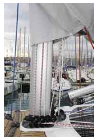
Степс мачты: установлен на палубе и исполнен вполне солидно