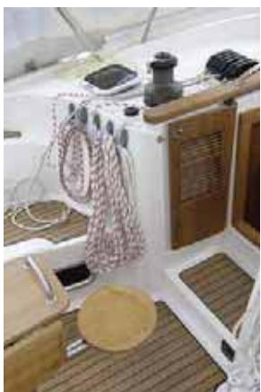
Носовая часть кокпита: фиксирующиеся дверцы сходного люка, аккуратные крючки для фалов, на переднем плане – выдвинутое сиденье