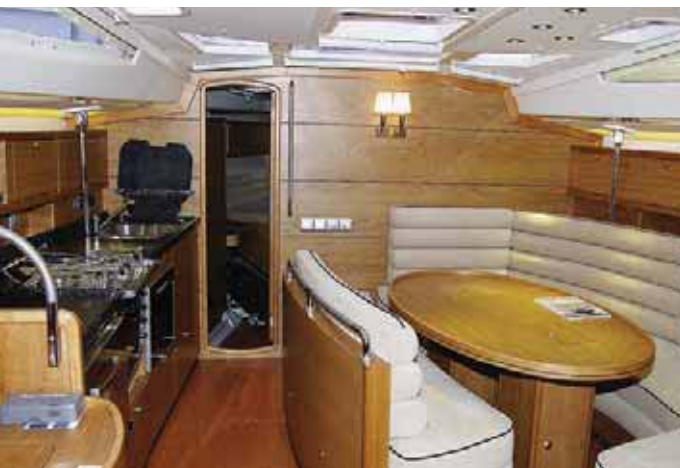
Салон: обращают на себя внимание плавные кривые линии, обилие дерева и необычная обивка дивана