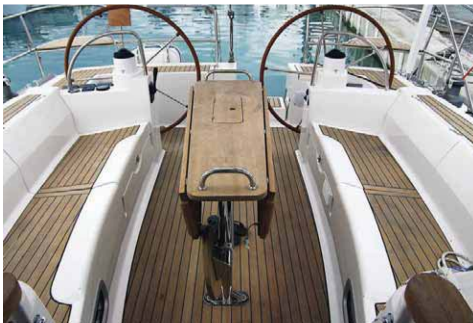
Кокпит: вместителен и удобен, но ящик в столе очень мал. Обращает на себя внимание выдвижное сиденье под столиком.