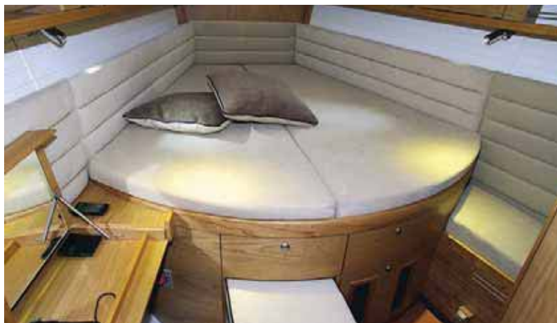
Носовая каюта: мягкая обивка стен вдоль койки, выдвигаемое сиденье и косметический столик

стала косоугольная переборка, отделяющая салон от гальюна. Знатоки сразу же вспомнят пиртерскую яхту «Пифагор» конструкции О.Ларионова (по странному совпадению имеющую такую же длину – 47 футов), где было применено похожее планировочное решение. С той только разницей, что на «Пифагоре» расположенная под углом к ДП переборка разделяла салон и носовую (хозяйскую) каюту. В остальном – все то же, включая планировочные преимущества. Садиться за стол теперь удобнее, салон визуально выглядит много просторнее, а острому углу, образовавшемуся в выгородке гальюна, тоже нашлось удачное применение. Везде одни плюсы. Кроме одной вещи: вклеивать в корпус переборку под острым углом к ДП гораздо труднее, чем под прямым. Для массовых яхт такое решение – нонсенс, но верфь идет на усложнение технологии, потихоньку отказываясь от позиционирования в массовом сегменте.