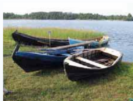
Карельские лодки, построенные для разных озер, заметно отличаются конструкцией