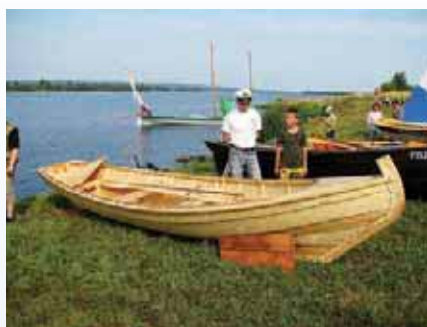
Кижанка О.Конжезерова построена с применением современных материалов и технологий