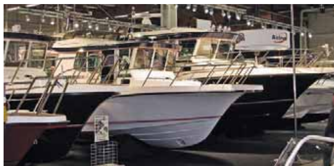
Nord Star» делает ставку на разнообразие комплектации существующих моделей