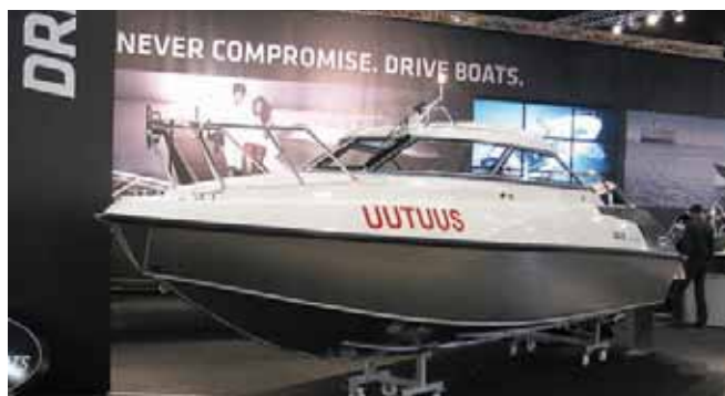
«Fiskars» пополнила семейство «Drive» рубочным вариантом «66 Hardtop»