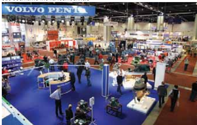
Стационары есть, но их на выставке стало меньше, чем, к примеру, в докризисные годы