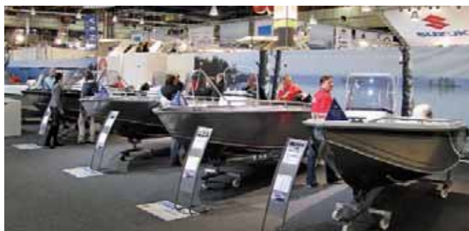
Конструкторы подразделения «Silver» в составе «TerhiTec OY» не спешат с новациями и спокойно занимаются рестайлингом прежних наработок