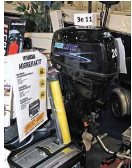
«Sea King» – редкий зверь не только в Финляндии, но и у нас, даже на Дальнем Востоке

Если лет пять назад в стенах Мессу-кескус (выставочный центр Хельсинки) стационары занимали огромные про-