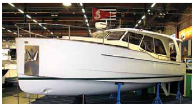
Лодка нынешнего бот-шоу – «Greenline 33» с гибридным двигателем

Родоначальник идеи алюмопластикового «пирога» «Silver», взирал на эту суету с истинно финским спокойствием – из его новинок был только двухконсольный «Silver Shark DC 580». Ви-