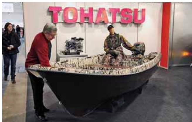
«Удобные пакеты» для охоты и рыбалки