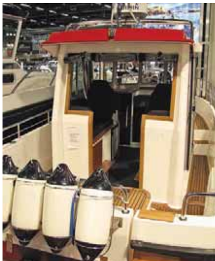
Неожиданный маркетинговый ход: каютный «Nord Star 24» переоборудован в «хардтоп»

Семейство «Drive» пополнилось новыми членами. В подкрепление первых ласточек – «Sport Console» и «Convertible» с корпусом «Buster XL» – пришли сразу трое: «Open 50», «Daycruiser 66» и «Hardtop 66». Первый – потомок «Buster X», такой же простой двухконсольной компоновки с носовым кокпитом, следующие двое – с корпусом «Buster XXL» длиной 6.6 м. «Daycruiser» – открытый со спальня каютой-убежищем под носовой палубой, «Hardtop», понятно, к тому же с жесткой полурубкой и носовой каютой, не изолированной от кокпита. В оборудовании угадывается прежняя «бустеровская» солидность, о чем говорят даже оригинальные подрессо-