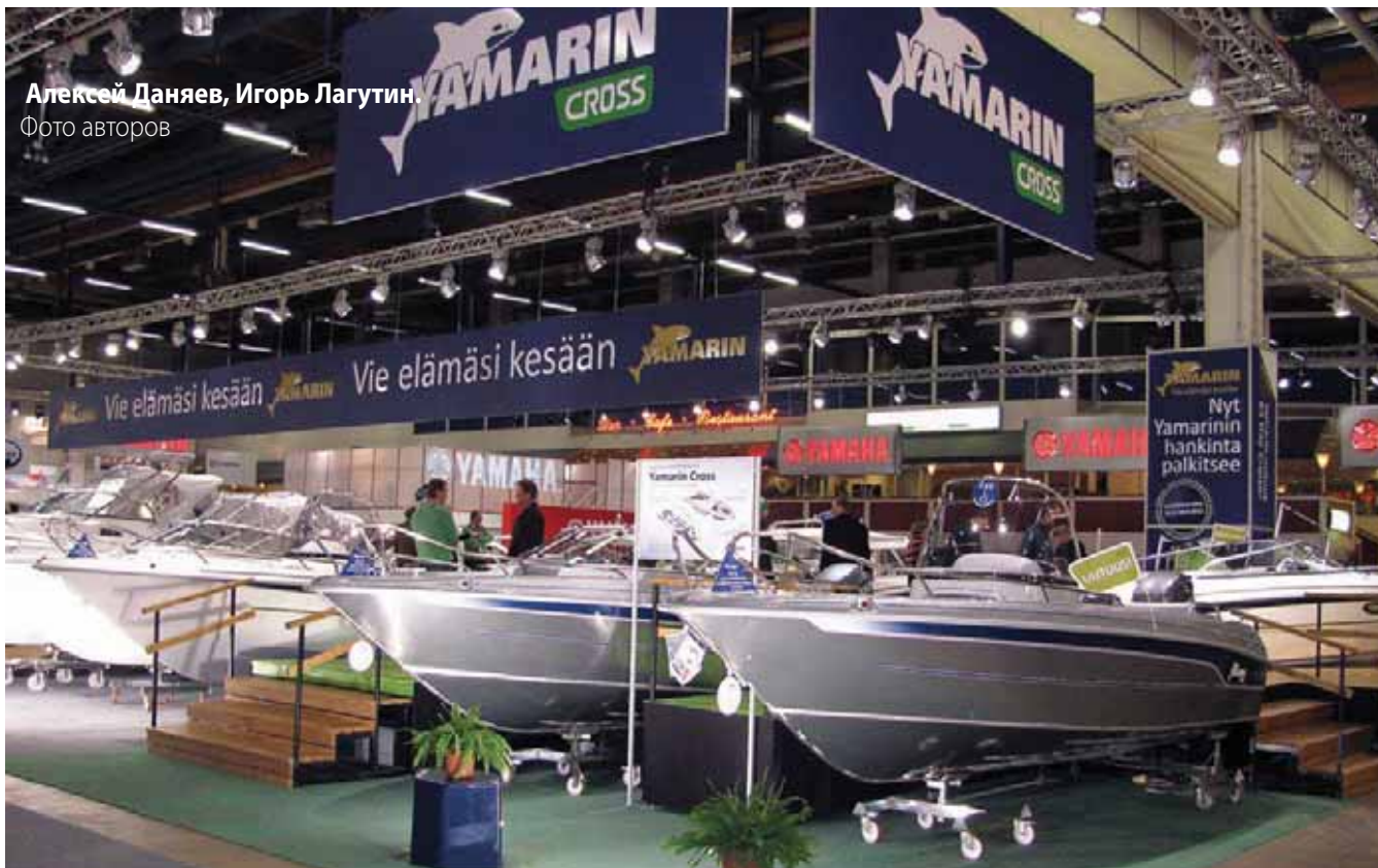
Алексей Даняев, Игорь Лагутин. Фото авторов

«Yamarin» выстроил свой новый бренд «Cross» на проверенных компоновочных решениях