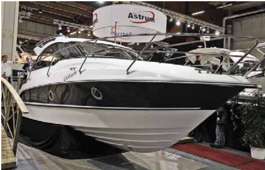
Новинка от «Finn-Marín» – «Grandezza 27» с модным минималистическим интерьером

димо, в составе «TerhiТес ОУ» и союзе с цельнометаллическими «Faster» компания чувствует себя достаточно защищенной от рыночных невзгод.