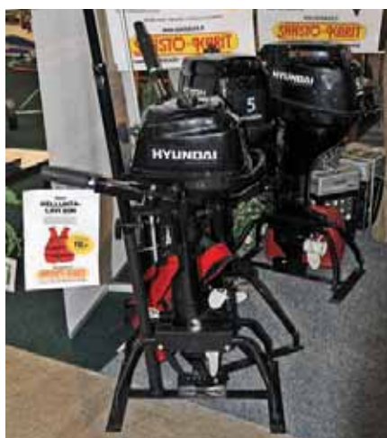
«Hyundai» – клоны «Yamaha» и «Tohatsu», на вид достаточно качественные

Что особенно интересно – едва ли не каждый второй посетитель выставки оказывался русскоговорящим, потому что ее популярность среди «наших» высока. Несмотря на любые перемены в отраслевой конъюнктуре, и организаторы, и участники «Vene/Båt» отличаются завидным постоянством в следовании интересам массового судовладельца, дают шанс увидеть состояние сразу всей финской индустрии отдыха на воде и по-прежнему рассчитывают на нашего покупателя. ■