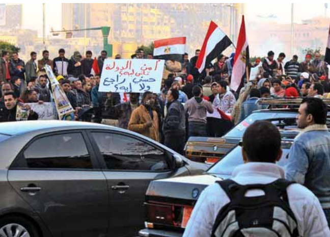
Площадь Тахрир в Каире в дни революции

Утро началось с ужасных воплей на улице, от которых я подскочила, решив, что началась война. Оказалось – всего лишь служба в мечетях, которая