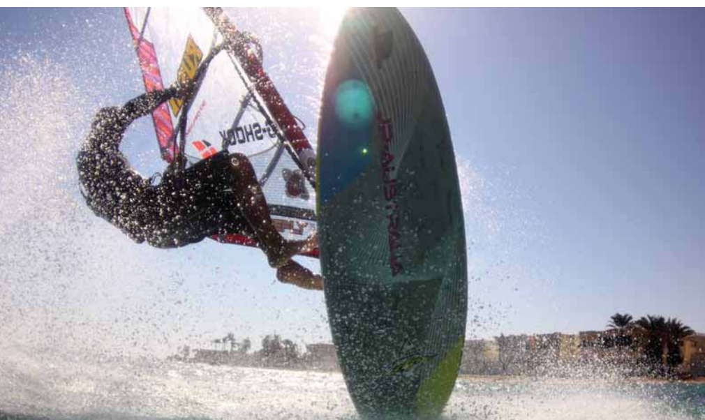
Элемент фристайла «Willy Skipper»

щих от солнца, ведь если падать в воду не намерен, то и гидрокостюм особо не нужен.