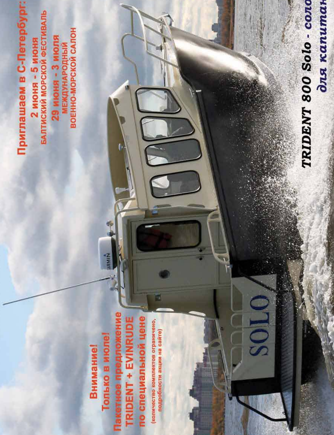
TRIDENT 800 Solo - соло для капитана!

Производство цельносварных стапельных алюминиевых катеров. С-Пб, г. Ломоносов, Транспортный пер. 9, тел. +7 (812) 423-32-23, E-mail: katera@tridentboats.ru WWW.TRIDENTBOATS.RU