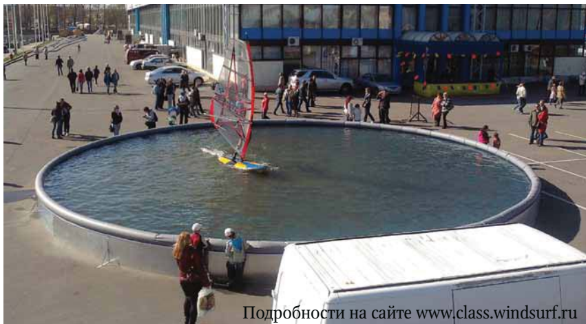
Подробности на сайте www.class.windsurf.ru