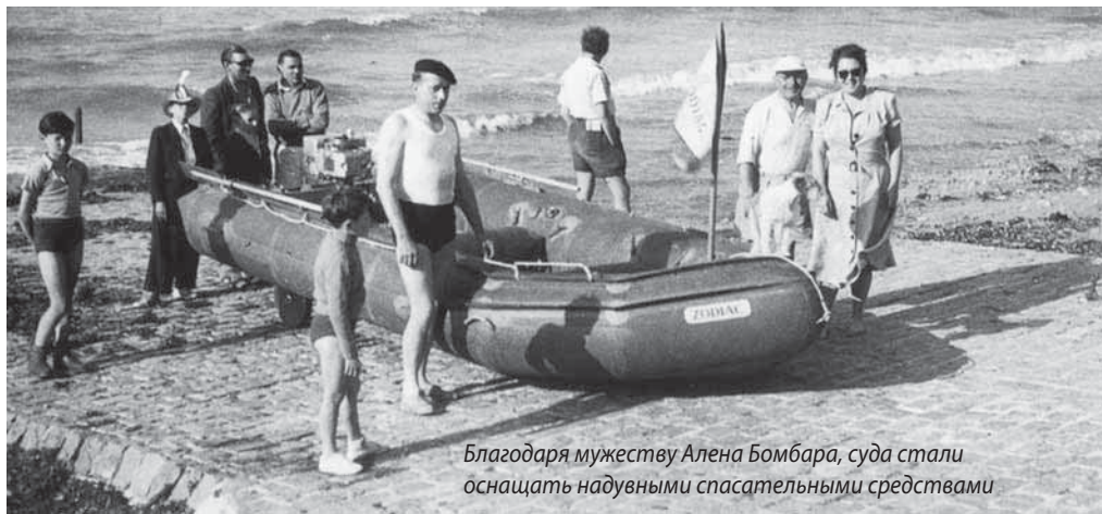
Благодаря мужеству Алена Бомбара, суда стали оснащать надувными спасательными средствами

Не побоюсь утверждения, что у россиянина надувная лодка всегда ассоциировалась со словом «свобода». Тем более, что некоторые мо-