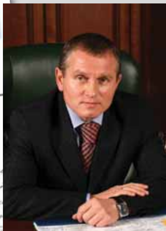
Юнис Лукманов, президент Федерации водно-моторного спорта России

Уважаемые коллеги! С большим интересом и удовольствием мы узнали о вашем юбилейном номере. Вы всегда были и будете самым интересным журналом в мире. Хотим поздравить вас с этим событием и пожелать дальнейшего процветания, увеличения тиража и успешного развития. Журнал занимает достойное место в мире спорта. Будем рады видеть вас в числе наших партнеров. С уважением, Президент Федерации водно-моторного спорта России Юнис Лукманов