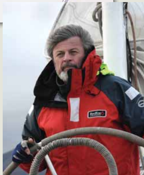
Капитан Николай Литаяу