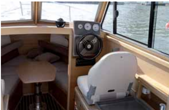
Рулевая рубка просторна и в ширину, и в высоту. И пост водителя занимает в ней не главное место