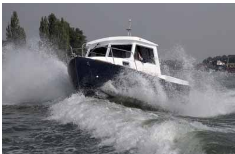
Высокобортный корпус уверенно проходит волну

чистотой решений. Видно, что здесь поработал декоратор, а не только технолог с краснодеревщиком. Применена шпонированная фанера светлых тонов, с ней гармонируют оттенки серого в поверхностях панели управления, столешницы камбуза, подушек лежанок и сидений. Настил палубы имитирует тиковую рейку. Светильники современные, логично вписывающиеся в геометрию обстройки – длинные светодиодные планки на подволоке, заодно закрывающие стыки панелей зашивки. «Высокая» часть рубки полностью отдана под служебные нужды – здесь пост управления, камбуз и просторный галюнь в отдельной выгородке.