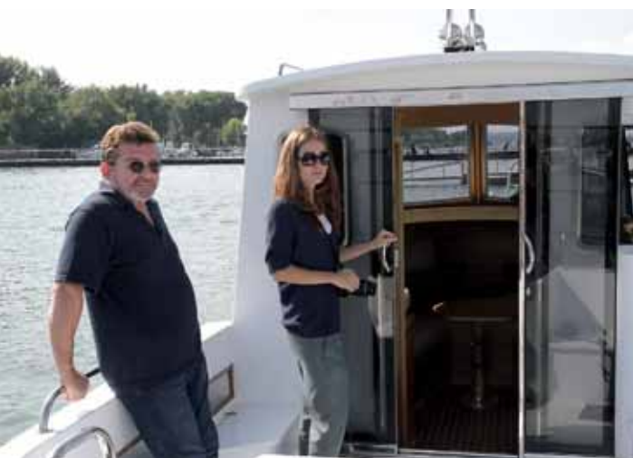
У «парадного входа» – группа разработчиков проекта