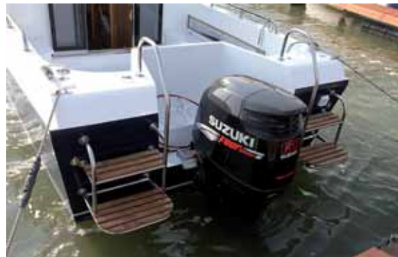
Развитые транцевые площадки понравятся и рыбакам, и купальщикам