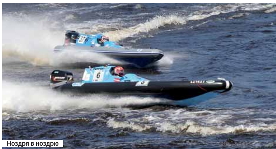
Ноздря в ноздю