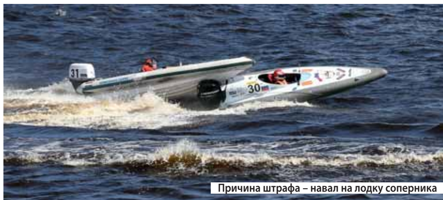
Причина штрафа – навал на лодку соперника

поначалу только четыре экипажа – венгерская команда умудрилась повредить днище лодки еще во время тренировочных заездов и на воду вышла только часа через три после старта. Не заладилась гонка и у команды Palitech – двигатель перестал развивать должные обороты, поэтому борьба развернулась в основном между тремя командами – нашей, эстонской (кстати, так же как и мы, имевшей в составе представительницу прекрасного пола) и латвийской, что называется, «ноздря