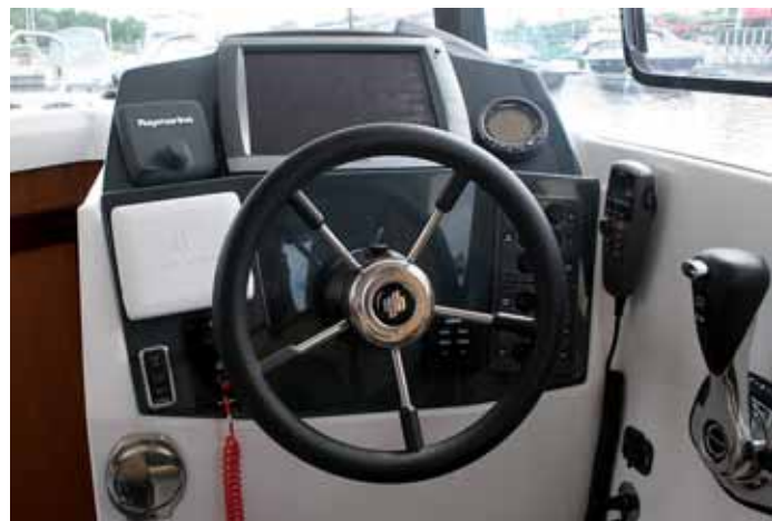
Обзор с места водителя практически круговой. Небликующая приборная панель скомпонована плотно и информативно