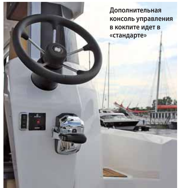
Дополнительная консоль управления в кокпите идет в «стандарте»

печную «детскую» каютку, с недетским размером 1.9 на 1.4 м. Чтобы забраться в нее, необходимо проявить ловкость, наградой будет, например, возможность для матроса выспаться после вахты, не мешая товарищам. Или возможность просто забросить туда вещи второй необходимости. Для хранения не слишком деликатного имущества подойдет и вместительный трюм под крышкой в палубе салона, он же подходит для размещения опционального топливного бака увеличенной емкости. Еще пара спальных мест получается трансформированием диванов салона со снятием