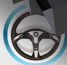
Рулевые системы Ultraflex