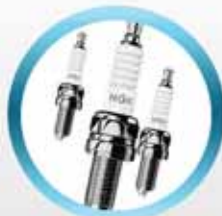
Свечи зажигания NGK