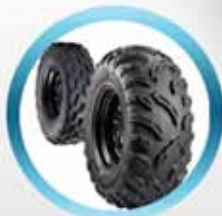
Шины для квадроциклов