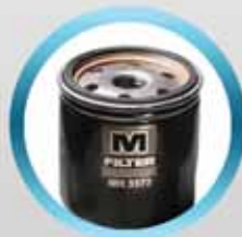
Топливные и масляные фильтры