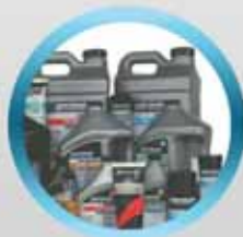
Масла и смазки