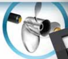
Винты гребных Solax