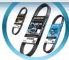
Ремни вариаторов для снегоходов