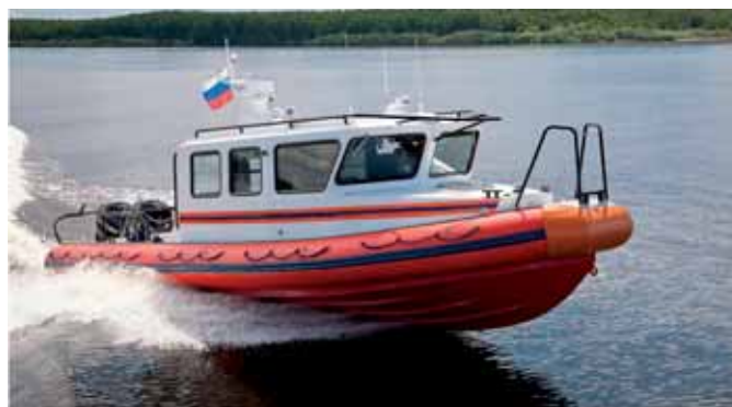
Катер «Лидер 10»: длина – 10,2 м, водоизмещение – 6 т, максимальная скорость – 35 уз, мореходность – до 5 баллов, дальность плавания – 200 миль, пассажироместимость – 12 чел., грузоподъемность – 1500 кг, два подвесных лодочных мотора Mercury Verado 300XL, эхолот, навигатор

четырёх судов на воздушной подушке для патрулирования в труднодоступных местах и в осенне-зимний период, более 90 автомобилей. Для работы в зимний период на вооружении подразделения ГИМС стоят снегоходы.