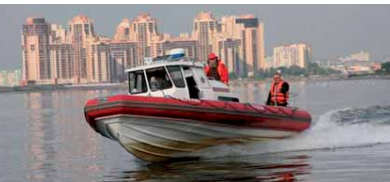
Катер «БЛ-820»: длина – 8,2 м, водоизмещение – 4 т, максимальная скорость – 25 уз, мореходность – до 5 баллов, дальность плавания – 200 миль, пассажироместимость – 12 чел., грузоподъемность – 1500 кг, стационарный двигатель MerCruiser QSD 4.2 ES мощностью 320 л.с., эхолот, навигатор