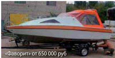
«Фаворит» от 650 000 руб