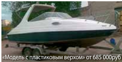
«Модель с пластиковым верхом» от 685 000руб