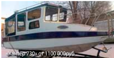
«Хантер 730» от 1100 000руб