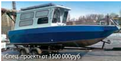
«Спец. проект» от 1500 000руб