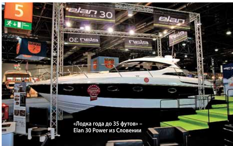
«Лодка года до 35 футов» – Elan 30 Power из Словении

на Boot-2014 широко, по площади оно оставило позади экспозиции Финляндии, Испании, Бельгии, Словении... У него в активе и парусные яхты, и речные траулеры, и быстроходные катера. Интересно выглядела новинка от верфи Atlantic Marine (мы писали о ней в №246), крупный катер «всепогодного» типа Adventure 900 под дизели Volvo Penta D3–D6. Видимо, на ее появление благотворно повлиял перенос производств из