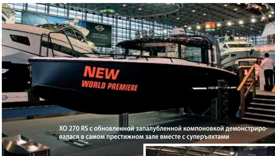
ХО 270 RS с обновленной запалубленной компоновкой демонстрировалась в самом престижном зале вместе с суперяхтами

Sportdeck, Sundeck и Spacedeck. Первый – двухконсольник с вейковой мачтой, у второго на носу широкий солярий с очень низкой, но широкой спальня каюткой снизу, третий, одноконсольный, предоставляет для вольного размещения всю площадь палубы, а под консолью скрывается компактный галюнь, он же вспомогательное помещение-каптерка. Все вы-