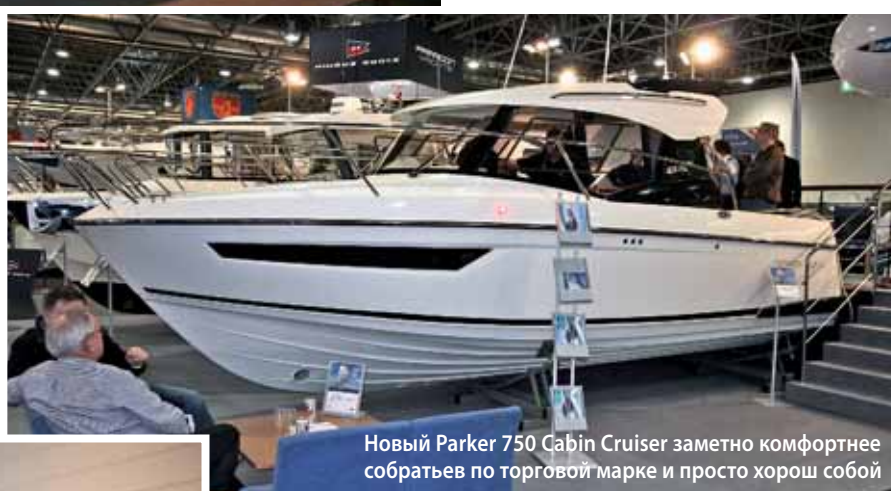
Новый Parker 750 Cabin Cruiser заметно комфортнее собратьев по торговой марке и просто хорош собой

Sportdeck, Sundeck и Spacedeck. Первый – двухконсольник с вейковой мачтой, у второго на носу широкий солярий с очень низкой, но широкой спальня каюткой снизу, третий, одноконсольный, предоставляет для вольного размещения всю площадь палубы, а под консолью скрывается компактный галюнь, он же вспомогательное помещение-каптерка. Все вы-