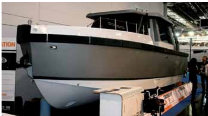
Неброские, но замечательные по концептуальной новизне экспонаты: итальянский катер-кроссовер Ethos 30 модульной конструкции с гибридным приводом