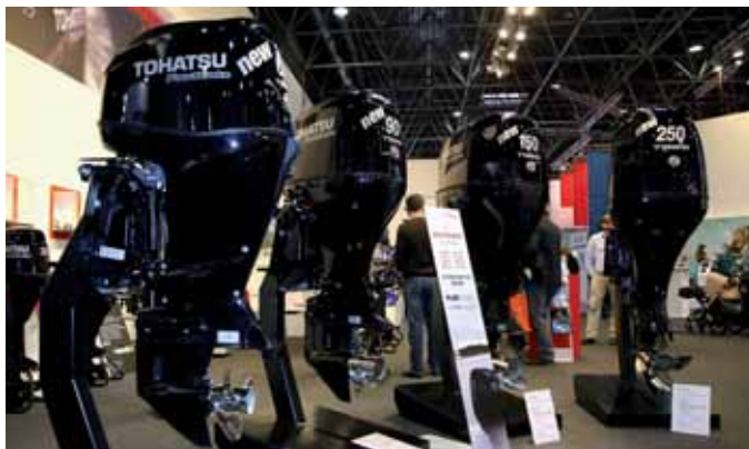
Моторы Tohatsu наконец заполнили верхний сегмент своего мощностного ряда