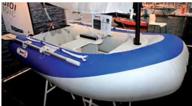
Надувнушка с «настоящим» парусным вооружением и центральным швертом DinghyGo из Нидерландов