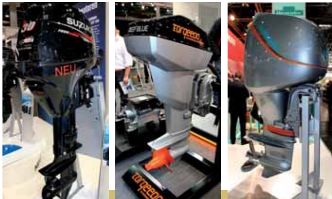
Яркие новинки года среди подвесников: Suzuki в 30 л.с., мощный электромотор Torqeedo и подвесной дизель Neander Shark