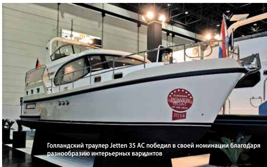
Голландский траулер Jetten 35 AC победил в своей номинации благодаря разнообразию интерьерных вариантов

единяющим их довольно просторным салоном внизу плюс диванный уголок в тентуемом кокпите выполнены на хорошем европейском уровне и обеспечивают комфортное пребывание на борту при любой погоде за 169 000 евро.