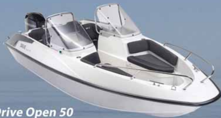
Drive Open 50