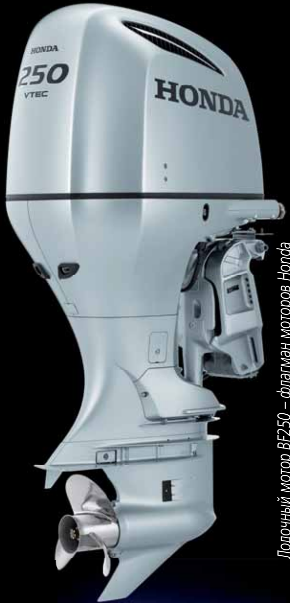
Лодочный мотор BF250 – флагман моторов Honda