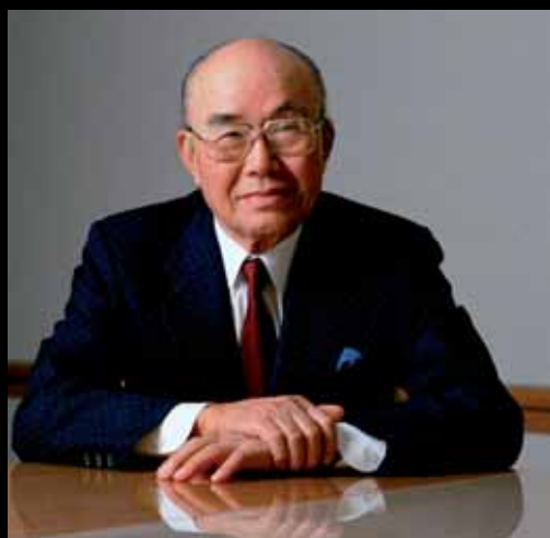
Соичиро Хонда – основатель компании

Уже в те годы основатель компании Соичиро Хонда был глубоко озабочен состоянием окружающей среды. «Все, что попадает в воду – должно быть чистым!» – этим и была обусловлена приверженность Honda Marine исключительно к четырехтактным технологиям. Так же трепетно Соичиро Хонда относился к двигателям в целом: «Это ж мои дети, – говорил он, – и каждого надо научить силе мечты».