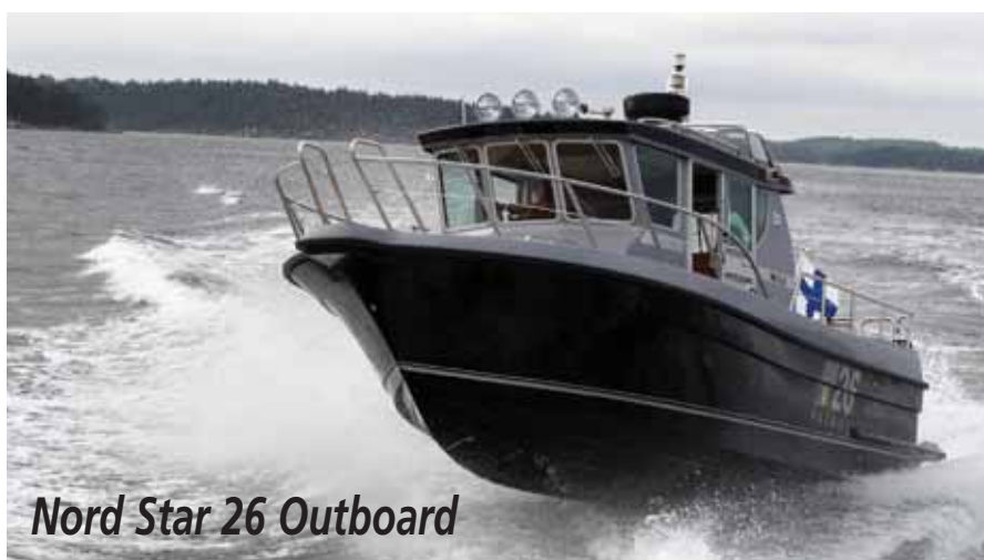
Nord Star 26 Outboard

Идем дальше в сторону увеличения размера и обитаемости. А значит, и комфорта пребывания на воде.