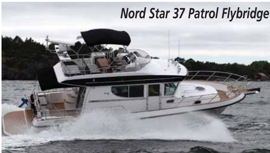
Nord Star 37 Patrol Flybridge

обитаемости удалось добиться за счет отказа от стационара. Установка двух подвесников по 150 сил позволила разместить в кормовой части небольшую отдельную «каютку» – а это пятое спальное место вдобавок к 4 в мастер-каюте. Эргономика здесь вообще на высоте – чего стоит сдвижная столешница, под которой скрывается компактный полноценный камбуз с плитой, мойкой и холодильником! Все готово к большому походу.