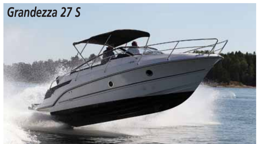
Grandezza 27 S

установка подвесников вместо дизельных стационаров, и за год стало ясно – идея себя оправдала. Среди очевидных плюсов – дополнительное пространство на борту, экономия