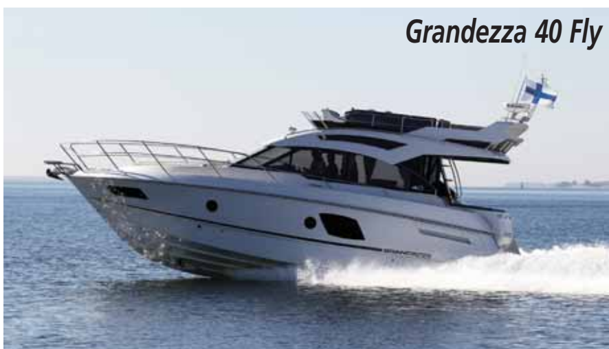
Grandezza 40 Fly