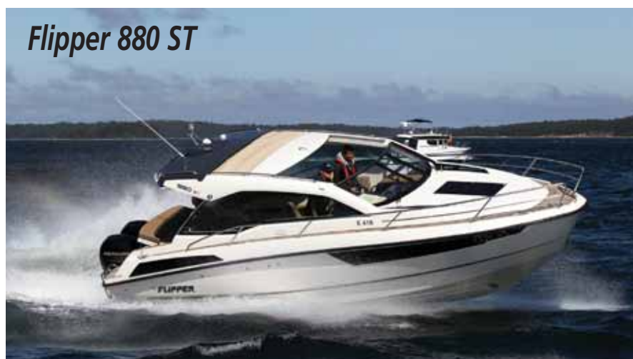
Flipper 880 ST

полноценный гальюн, камбуз, столик с диванной группой – а вот здесь все уже «по-взрослому»!