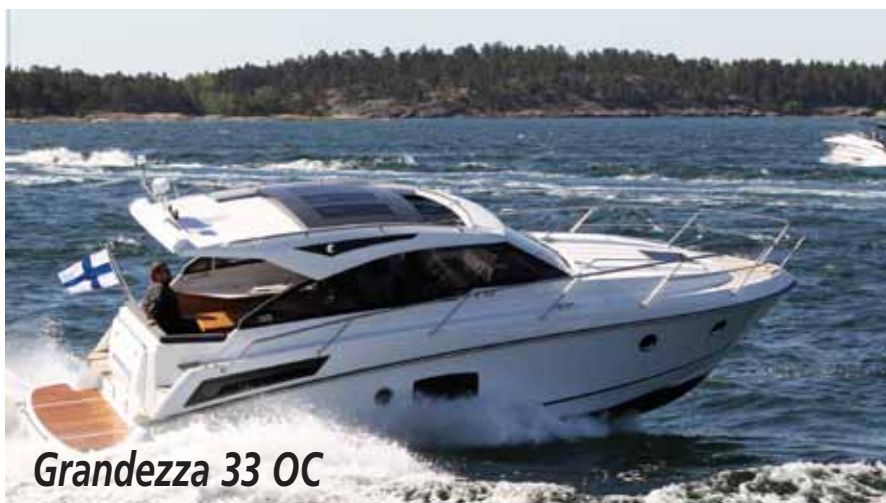
Grandezza 33 OC