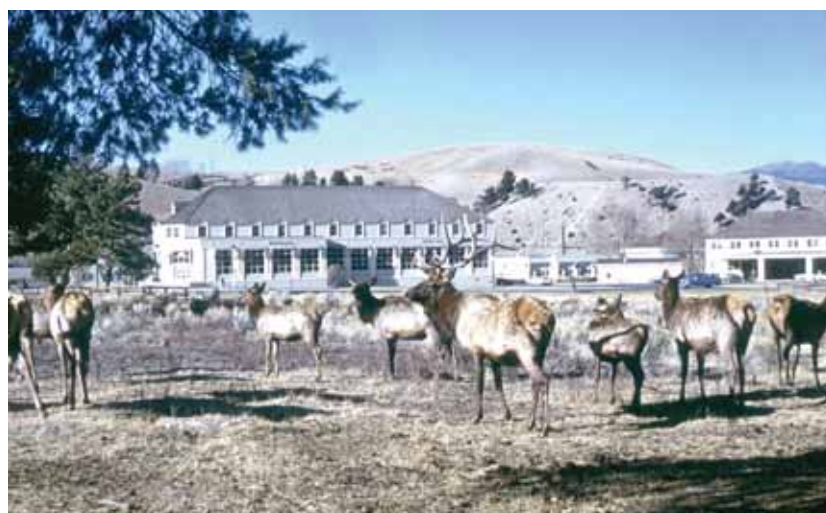
Дикие олени вапители