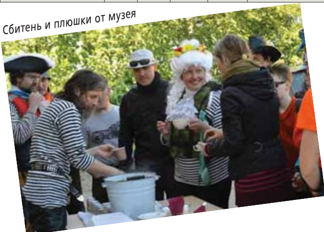
Сбитень и плюшки от музея