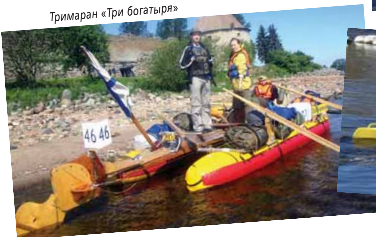
Тримаран «Три богатыря»

Лодки разбирали и грузили тут же, возле музея, недалеко от Храма Александра Невского. Два красавца-