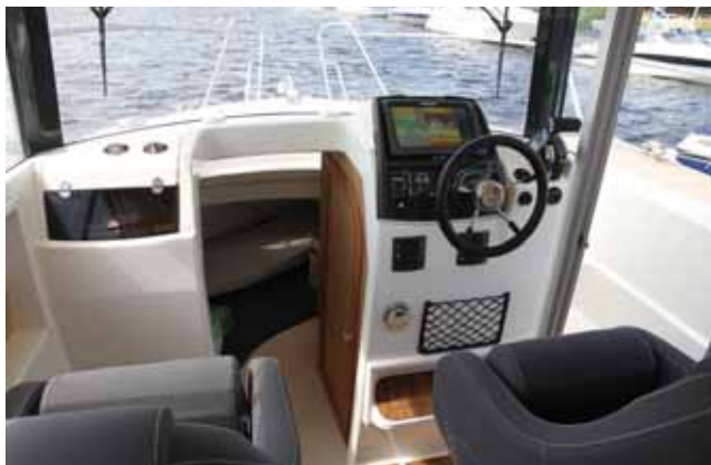
Пост управления компактен и лаконичен. Ничто не стесняет водителя, и он не стесняет гостей на борту