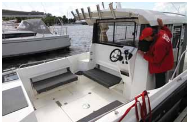
Кокпит, несомненно, занимает особое, самостоятельное место в планировке Parker 800 Pilothouse

ее длина относительно мала из-за развитого кокпита, спальное место за креслами в длину уже не помещается. Зато оно помещается в ширину у кормовой стенки рубки (помним, что корпус всех «800-х» моделей шириной уже превышает автодорожный габарит) на рундуке, который играет роль и камбузной тумбы, и даже осталось немного места для скромного обеденного столика. Через кормовую сдвижную форточку можно покричать в кокпит или устроить в рубке освежающий сквозняк.