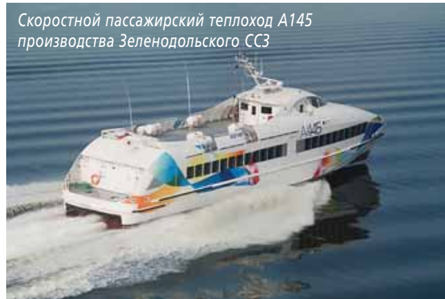
Скоростной пассажирский теплоход А145 производства Зеленодольского ССЗ

как «Мнев и К», Silver, «Меркурий-НИИТМ», «Мобиле Групп», ССЗ «Вымпел». Отметим продукцию некоторых из них.