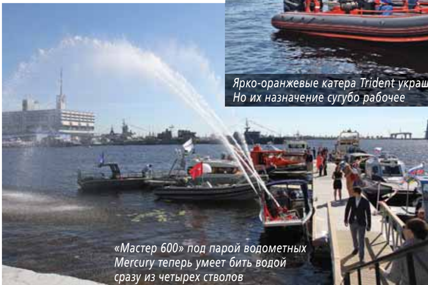
«Мастер 600» под парой водометных Меркури теперь умеет бить водой сразу из четырех стволов