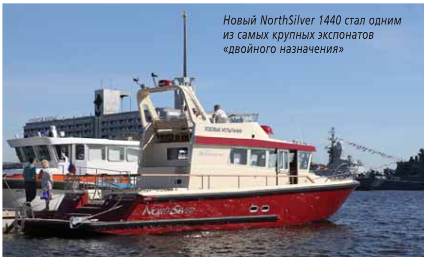
Новый NorthSilver 1440 стал одним из самых крупных экспонатов «двойного назначения»

Несмотря на готовность некоторых иностранных компаний открыть производство двигателей в России, в Санкт-Петербурге, никто не спешит вкладывать средства в такое производство. Причем сказанное относится к дизелям, прошедшим необходимые испытания и одобренным для применения Главным штабом ВМФ России. Импортозамещение – необходимый, но длительный и трудный процесс; количество и качество продукции необходимой как ВМФ России, так и гражданскому сектору медленно, но верно растёт ✍