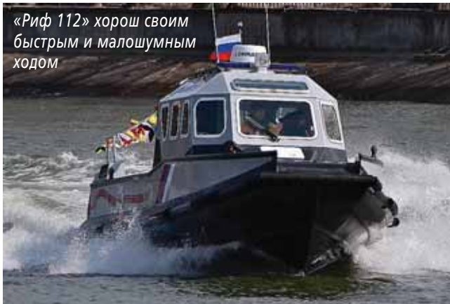
«Риф 112» хорош своим быстрым и малошумным ходом