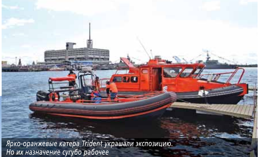
Ярко-оранжевые катера Trident украшали экспозицию. Но их назначение сугубо рабочее

Сравнение с предыдущими выставками демонстрирует рост популярности события. Если в МВМС-2009 участвовало 350 предприятий из 28 стран, из них 67 – иностранные фирмы, и выставку посе-