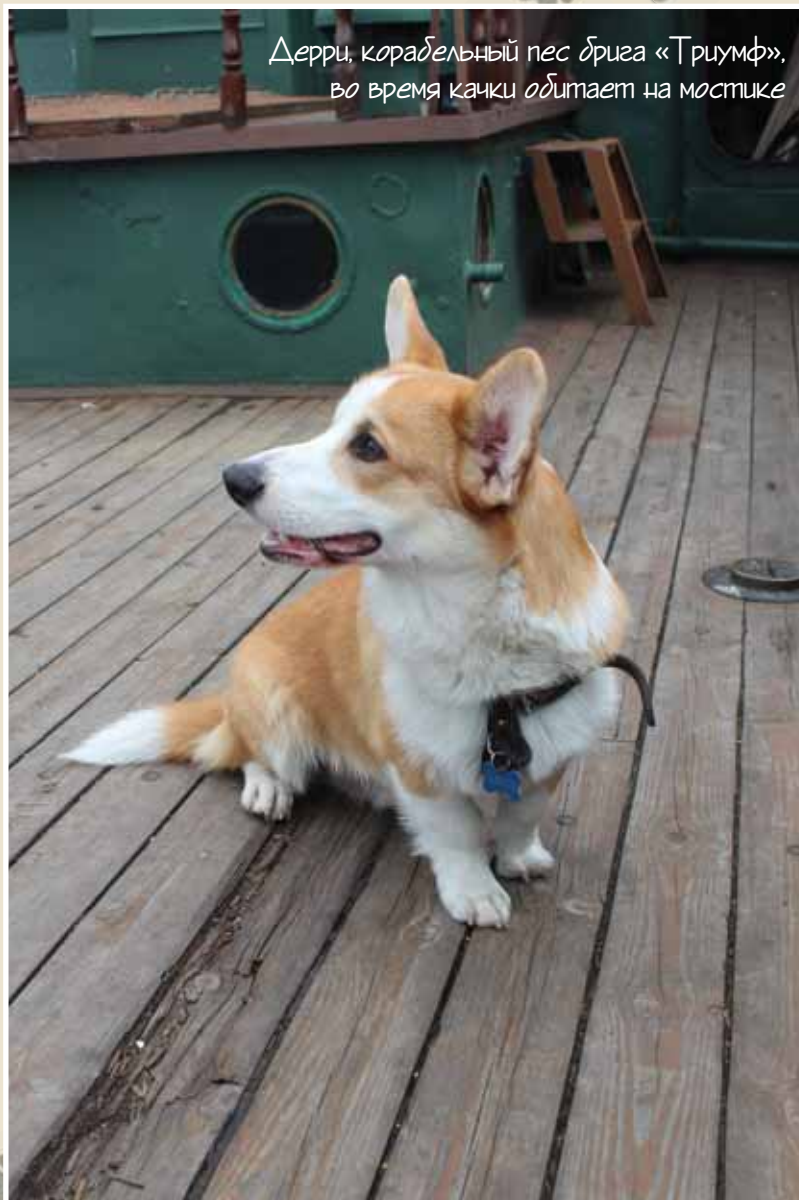
Дерри, корабельный пес брига «Триумф», во время качки обитает на мостике

Вовсе не отпускать собаку с поводка на природе, согласитесь, не реально. И именно после того случая нами был куплен GPS-ошейник Pettrack. При достаточно демократичной цене, чуть более 6 тыс. руб., устройство замечательно показывало свое положение на карте смартфона и планшета, позволяло «на спор» показывать гостям, до чего нынче дошла техника. Но было,