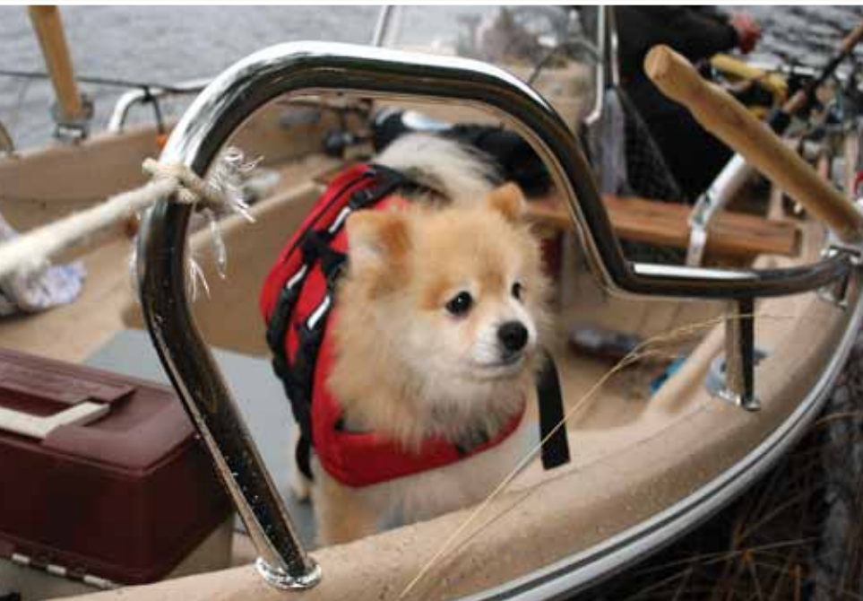
Майло предпочитает экстремальную рыбалку

тем не менее, положено на полку. Во-первых, купаться с ним нельзя, оно лишь влагозащищенное, а поди объясни это собаке... А главное, из-за небольших размеров и веса (что вполне логично) аккумулятор там хиленький и разряжается достаточно быстро, особенно в пол-