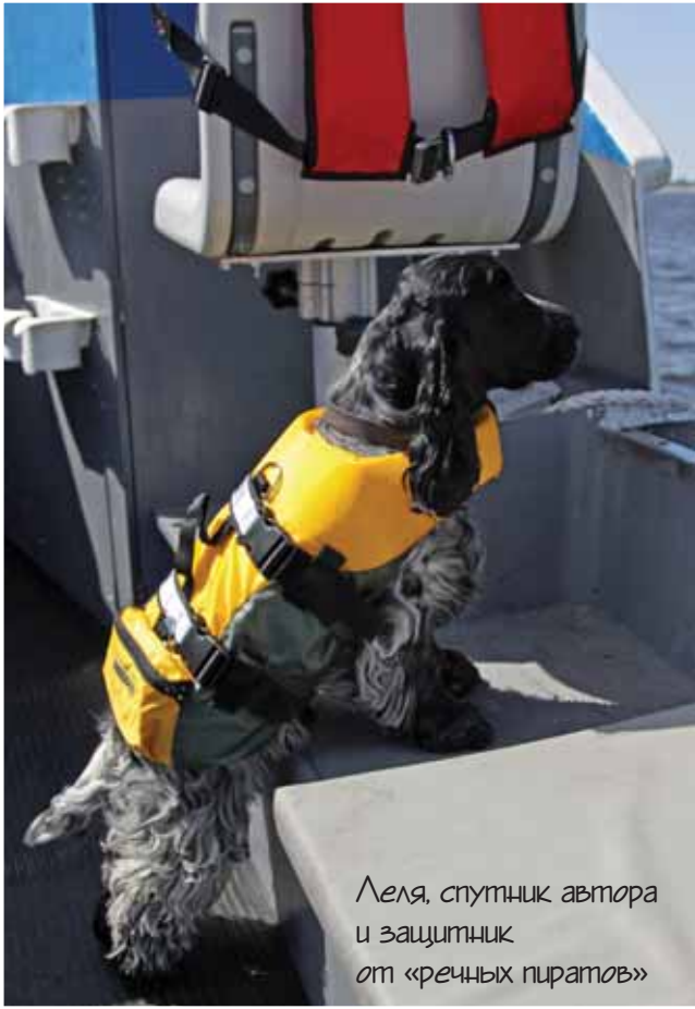
Леля, спутник автора и защитник от «речных пиратов»

животного. У разных производителей разная линейка, например, от 4 до 8 кг, от 8 до 12 и так далее. Не покупайте жилет, доверяясь весовым параметрам и портновскому метру. Примерьте перед покупкой, не пожалеете. К слову, это касается и всех человеческих спасательных жилетов, приобретаемых не для абстрактного пассажира, а для себя любимого! Для любителей кройки и шитья скажу, что в Интернете мне попадались выкройки и инструкции по самостоятельному изготовлению спасательных жилетов для всех видов домашних животных.